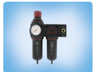
Lackiereinheit - LE075-04GCR Atemstation - AS075-04GCR

Weitere Informationen und Abbildungen zur Luftaufbereitung / Druckregler siehe Kapitel 17.